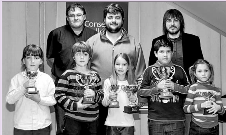
Imagen del podio del Torneo Escolar sub'8.

Como dato curioso, el Algaida no perdía en su terreno desde el 19 de marzo de 2005 y en aquella ocasión lo hizo frente al desaparecido CFAM de Maratxí.